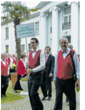
Vorne: Beim Festumzug waren die Bad Oeynhausener dabei.