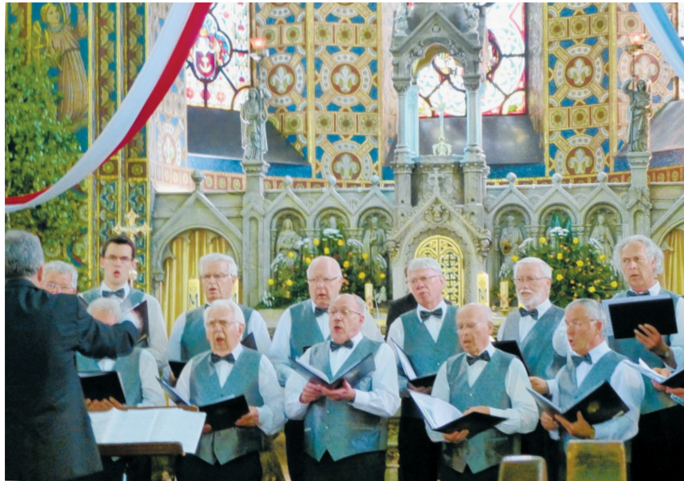
Gelungen: Beim Konzert in der großen Backsteinkirche „Empfängnis der Jungfrau Maria“ konnte der Quartettverein in neuen Westen seine Qualität beweisen.

Weiter ging es zum Solankipark zur Konzertmuschel. Die