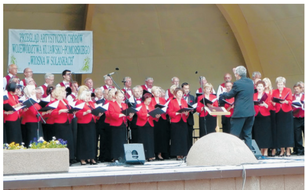
Einstimmig: In der prächtigen Konzert-Muschel traten die Bad Oeynhausener gemeinsam mit ihren Freunden vom Halka-Chor Inowroclaw auf.

Stuhlreihen und umliegenden Bänke waren vollbesetzt. Neun Chöre, darunter der Quartettverein, boten den Gästen bei strahlendem Sonnenschein ein Konzert, das alle begeisterte.