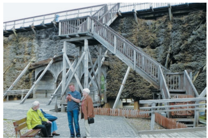
Imposant: Die Saline in Inowroclaw war den Bad Oeynhausenern einen Ausflug wert.