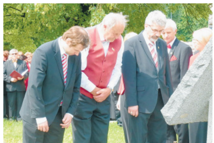
Tief bewegt: Die Delegation des Quartettvereins am Ehrenmal, das an Papst Johannes-Paul II. erinnert.